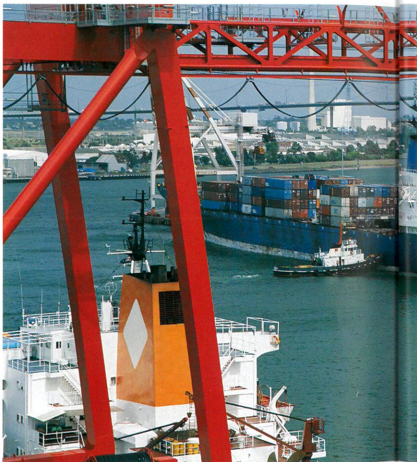
若中美間的貿易逆差情況未能有效改善，且大陸也未能積極開放國內市場，中美貿易戰恐將持續下去。

若以出口品項來看，雖然大陸大陸出口金額的逐年提高，但出口品項的競爭力分布情況仍存有